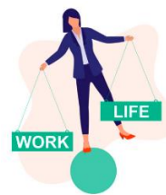
Calidad de vida