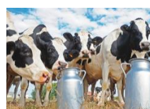
Calidad de la leche