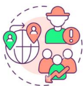
Escasez de mano de obra