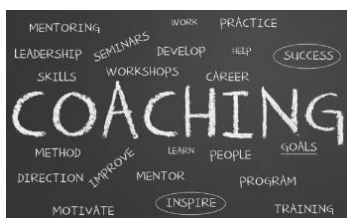
La necesidad de seguridad: ser apoyado, informado, tranquilizado, aconsejado