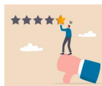
Crisis de reconocimiento