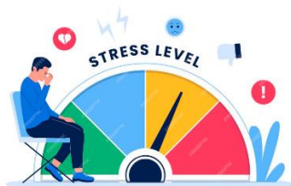
Multiplicación de restricciones