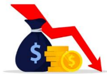
Diminution des revenus