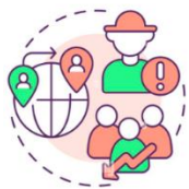
Pénurie de main d'oeuvre