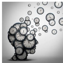
La gestion du temps