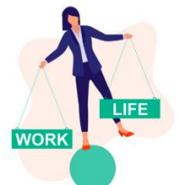
Qualité de vie