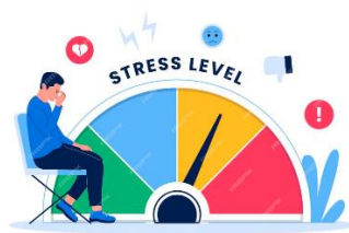
Multiplication des contraintes